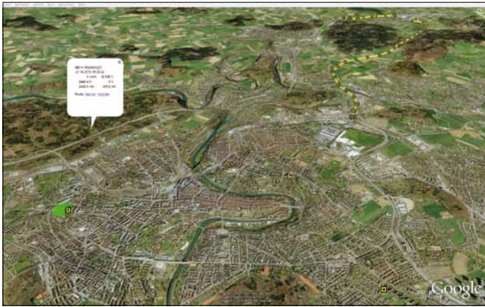
GPS Echtzeit-Ortung: Zwei Fahrzeuge unterwegs